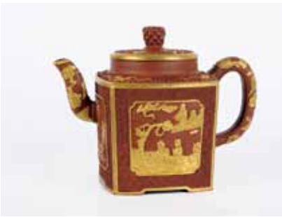
boven Aardewerken trekpot met reliëfdecor (gehoogd met goud) van een kraanvogel op tuit en oor, symbolen op deksel en voor- en achterkant en wijsgeren op de zijanten. China Yixing, gemerkt met zegelmerk Qianlong. H. 14,5 cm. Opbrengst € 100.000,-.

Wij weten natuurlijk van te voren niet wat we krijgen, maar dat hogere segment van de markt willen we hier wel uitbouwen.